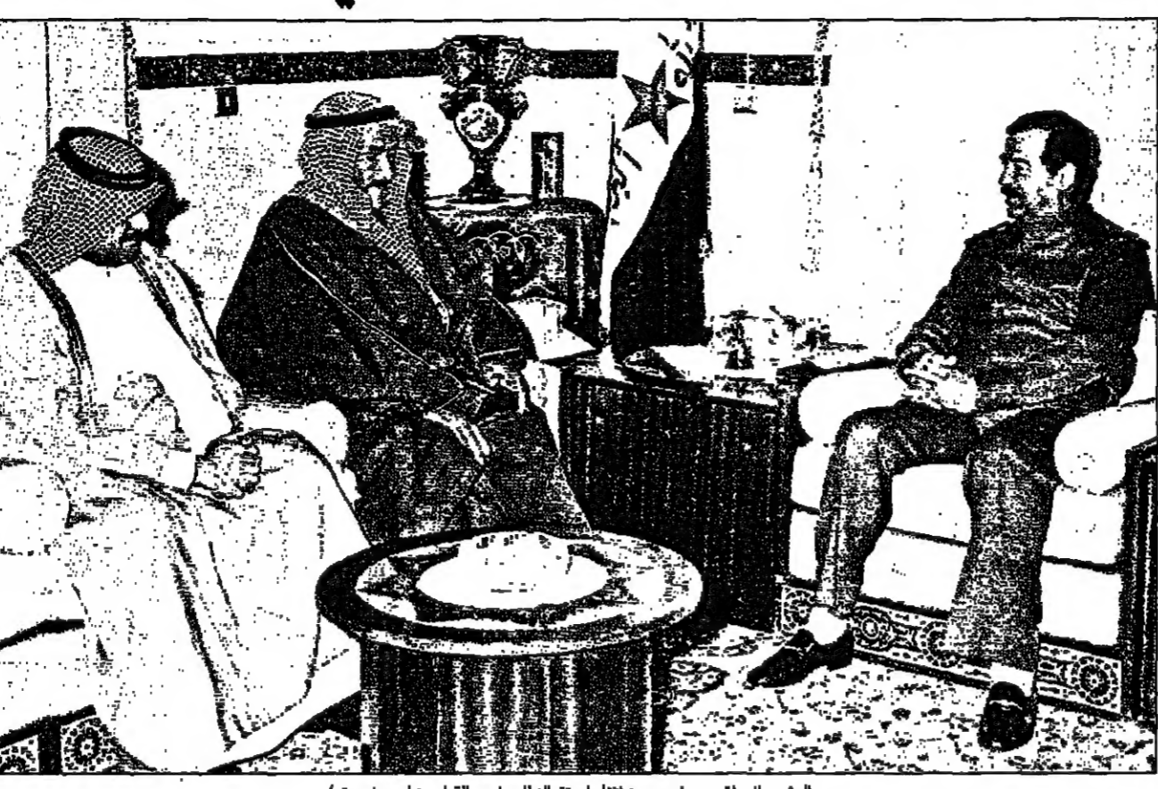
الرئيس العراقي صدام حسين أثناء استقباله للرئيس القطري امين بن نهيان

علاقات التعاون مع مصر في كافة المجالات الاقتصادية والتجارية، وأضاف الوزير في تصريحاته لوسائل الإعلام أن العراق مستعد لاستقبال وفد خليجي من الكويت لحل المشكلة الاقتصادية. وقال الوزير في تصريحاته لوسائل الإعلام أن العراق مستعد لاستقبال وفد خليجي من الكويت لحل المشكلة الاقتصادية. وقال الوزير في تصريحاته لوسائل الإعلام أن العراق مستعد لاستقبال وفد خليجي من الكويت لحل المشكلة الاقتصادية.